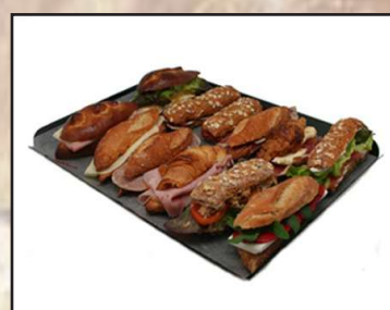
Bandeja de bocadillos variados 12 unidades 19,80€