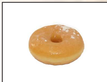
Donut coffee 1,10€