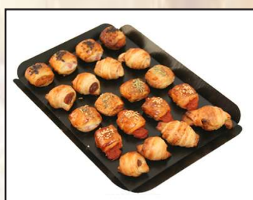
Bandeja de pequenos croissants salados 20 unidades 7,70€