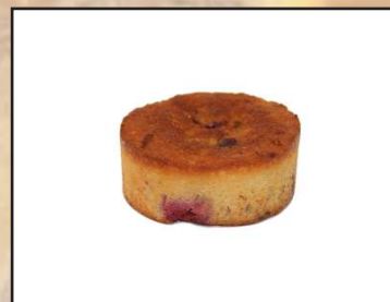
Bizcocho de cerezas 1,65€