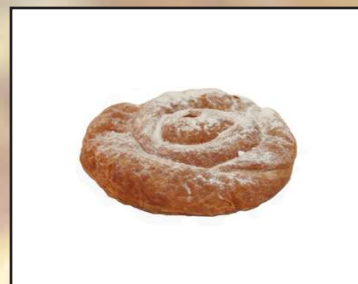
Ensaimada coffee 1,20€