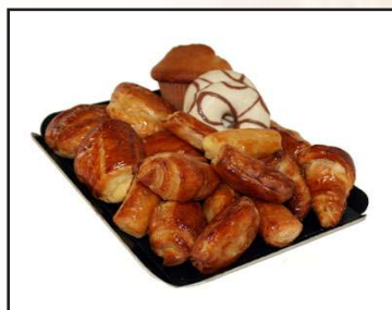
Bandeja surtido bolleria 10 unidades 13,30€