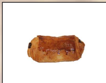
Napolitana de chocolate coffee 1,20€