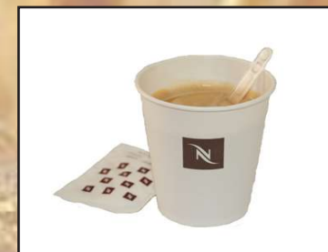
Café Nespresso 1,10€