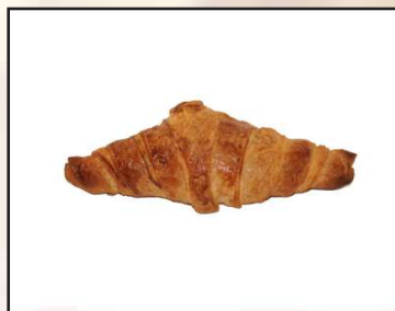
Croissant mantequilla coffee 1,10€