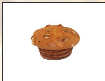
Muffin manzana 1,20€