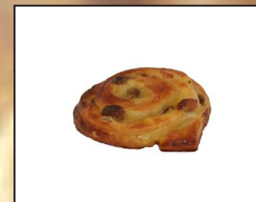
Snickers coffee 1,20€